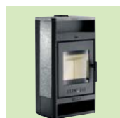
PBE 7 G